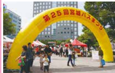
写真は昨年の模様です。